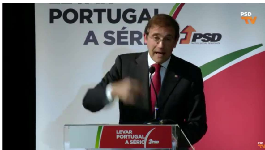
Pedro Passos Coelho na Sessão de Encerramento da Convenção Autárquica do PSD de Castelo Branco 21 visualizações