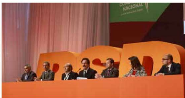
III Academia Poder Local | Guarda, 20 de novembro de 2016

A Academia do Poder Local é destinada essencialmente a autarcas em exercício de funções, mas também aberta a candidatos que, não sendo autarcas, estão interessados em melhor conhecer as matérias ligadas ao Poder Local. Todos os anos, cerca de 70 formandos são admitidos numa formação que conta com a colaboração de vários formadores prestigiados que vão abordar os mais diversos temas relacionados com o Poder Local.