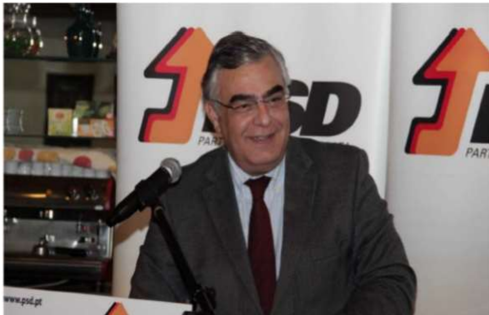
O secretário-geral do PSD esteve sábado, 9 de janeiro de 2016, num jantar de Reis promovido pelo PSD de Anadia, distrito de Aveiro. No sexta, dia 8 de janeiro, José Matos Rosa participou num jantar de Reis da Distrital do PSD e da JD de Castelo Branco.